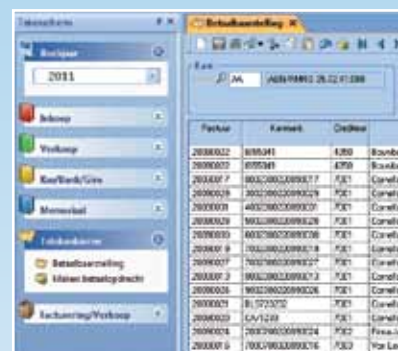
Uw dagelijkse taken vindt u terug in het overzichtelijke takerscherm